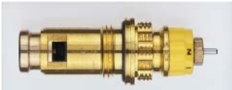
013 G 7381 / 1997 -