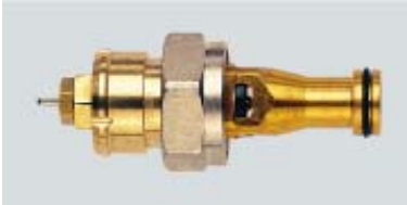
013 L 0215 / 1980 – 1989

Ersatz für 013L0215 ab 06.2006 Rote Voreinstellkrone / Codierung NJ Mit Reduzierstück 3/4" x 1/2" RA Fühleraufnahme