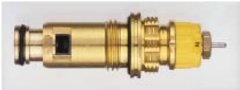
013 G 7371 / 1997 -