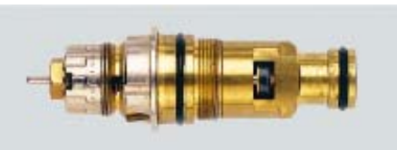
013 G 0270 / 1991 – 1997

Rote Voreinstellkrone, Montage mit 21mm Ringschlüssel Einschraubgewinde M22*1,0 Abstand der O-Ringe 43 mm