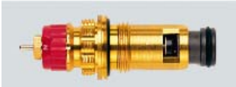
013 G 7370 / 1997 -