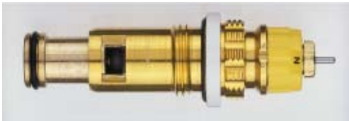
013 G 7361 / 1997 -