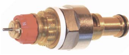
013 G 7315 / 013 G 7315