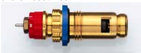
013 G 7482 seit 2001 Bezug nur über Heizkörperhersteller