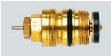
013 G 0245 (Flachkegel ab 1990) 013 G 0216 (konischer Kegel 1985-1990)

Montage mit 13mm Sechskant, Stopfbuchse 10mm