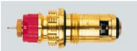
013 G 7390 / 1997 -