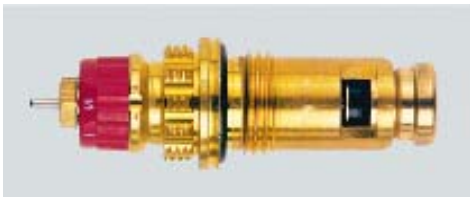
013 G 7380 / 1997 -