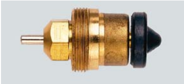
13 L 0219 / 1981 – 1986

Montage durch 3/4" Überwurfmutter, RAVL Fühleraufnahme