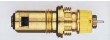
013 G 7391 / 1997 -