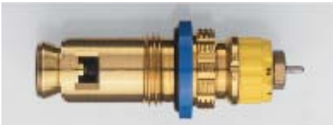
013 G 7483 seit 2001 Bezug nur über Heizkörperhersteller