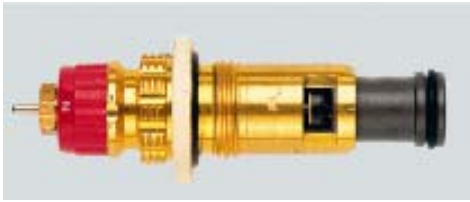
013 G 7360 / 1997 -